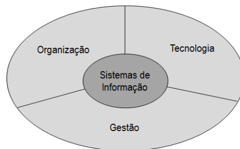
Figura 2. Dimensões de Sistemas de Informação (adaptado de Laudon e Laudon 2016)